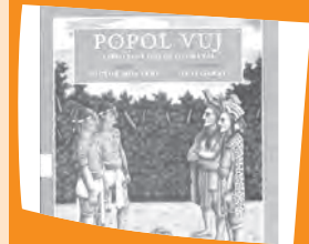
Popol Vuj: libro sagrado de los k'iche's.