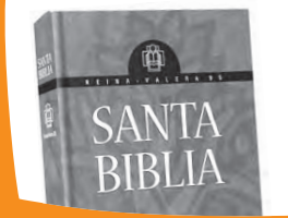
La Biblia: libro sagrado de los cristianos.

Comparta los valores que escribió con sus compañeros durante la orientación.