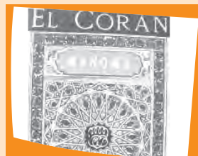
El Corán: libro sagrado del Islam.