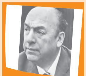
Pablo Neruda (1904 – 1973)