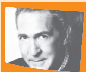
Antonio Gala (1936 – )