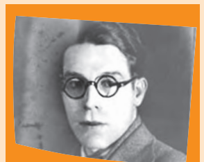
Herminio Almendros (1898 – 1974)