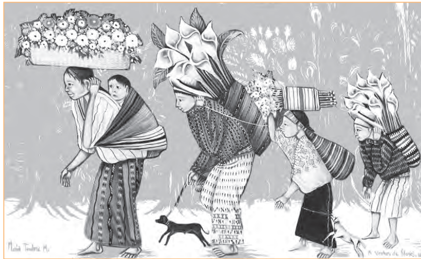
Detalle del cuadro Venta de flores , de María Teodora Méndez de González

A. ¿Se anima a describir la pintura de abajo? Observe con atención los detalles importantes y complete las oraciones con los adjetivos apropiados. Fíjese en el ejemplo.