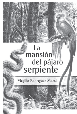
Título: La mansión del pájaro serpiente Autor: Virgilio Rodríguez Macal