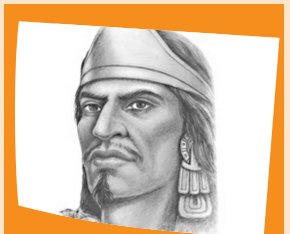
Nezahualcóyotl (1402 – 1472)