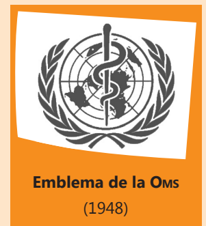
Emblema de la Oms (1948)

En 2009, la Organización Mundial de la Salud obtuvo el Premio Príncipe de Asturias de Cooperación Internacional.