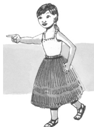
andar – caminar

acunar – mecer llamar – nombrar Carlos contestó que sí y Luis respondió que no.