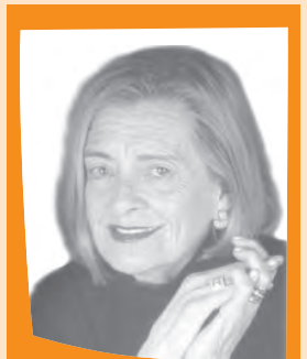
Josefina Aldecoa (1926 – 2011)